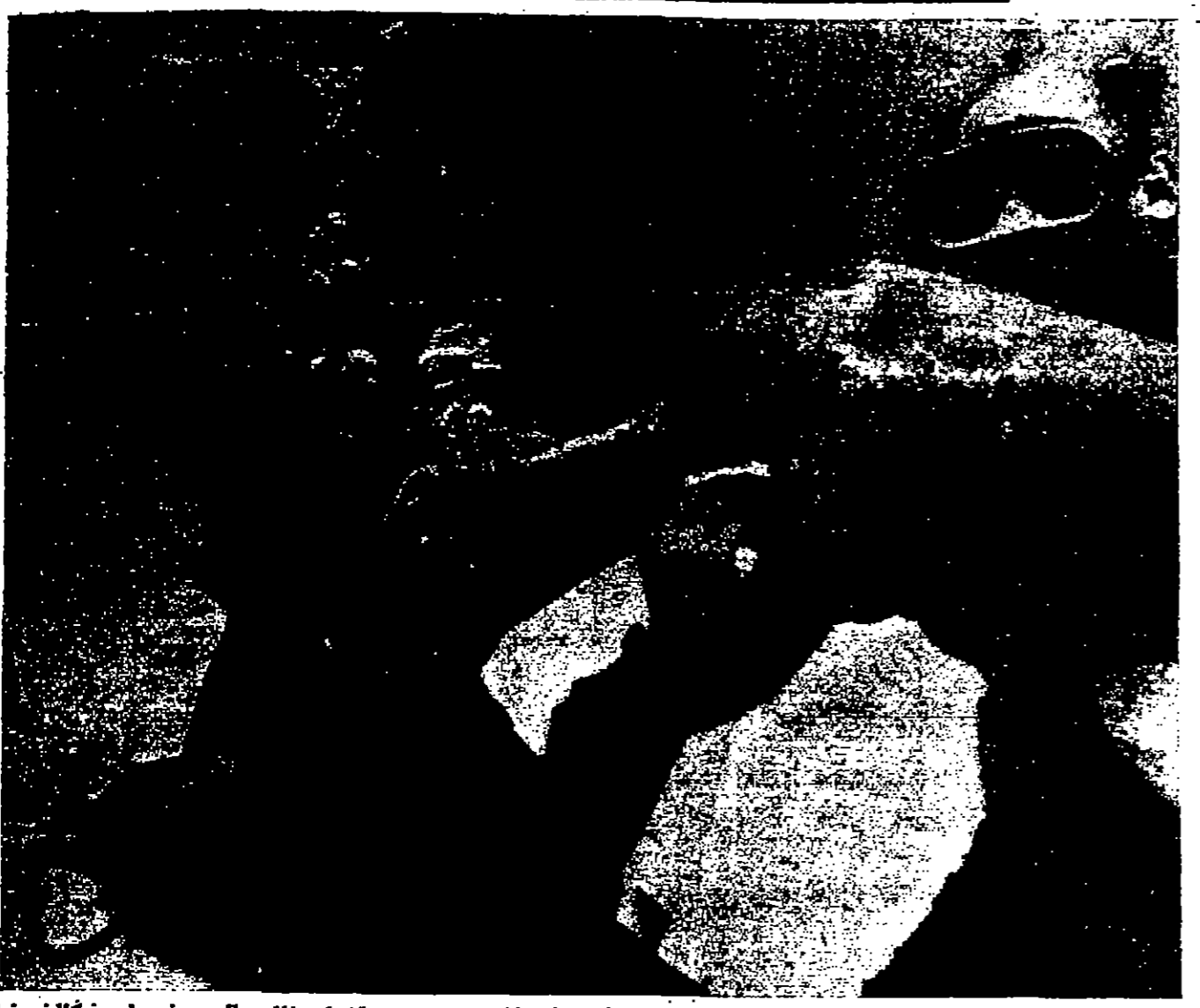
بعد ان قطع هذا الصوت الصفيحة سبعة الاف ميل على سطح الماء من جنوب أمريكا الى بلوس فير داس في كاليفورنيا فانه لا يتسرر باي ميل للاكل، ولكن صاحبه بصراخ على فتح عيجه بقصد اطماعه بالحفاظ على حياته... ويبلغ وزن هذا الصوت الصفيحة ٣٦٥ رطلاً (١٦٥ كغ) (صور من اوريونتوتو)